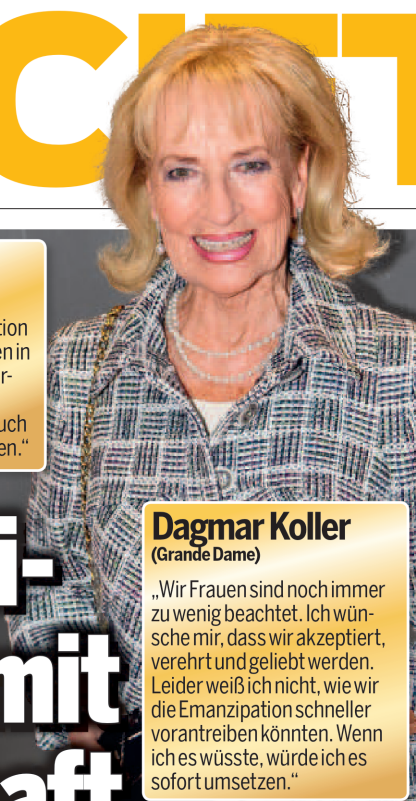
Dagmar Koller (Grande Dame)

„Gerade in der jetzigen Situation sollten wir vor allem die Frauen in der Ukraine unterstützen. Darüber hinaus wünsche ich mir, dass Frauen im Job endlich auch finanziell gleichgestellt werden.“